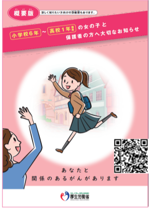
厚生労働省作成リーフレット

このリスクを予防できるのがHPVワクチンです。 新潟大学の研究では、ワクチンの 予防効果は90%以上 とされています。接種が進んでいるオーストラリアでは、2028年頃に新規子宮頸がん患者はほぼいなくなるとシミュレーションがされています。 (先進国では接種率が50%以上を超えているところが多いです)